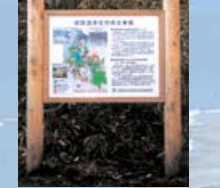
▲環境省自然再生事業協議