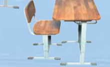
▲学校用机・椅子(カラ松集成材)