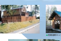
▲カラ松ラーチトップ