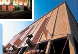
▲別海町 丹治牧場 牛舎