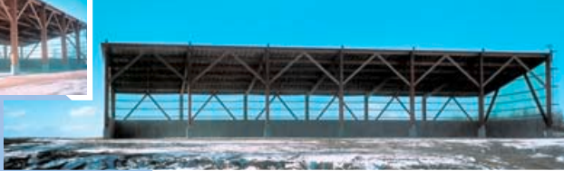
▼別海町西春別 門脇牧場 牛舎