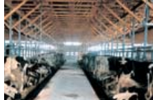
▲別海町西春別 海野牧場 牛舎