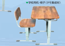
▼学校用机・椅子(タモ集成材)