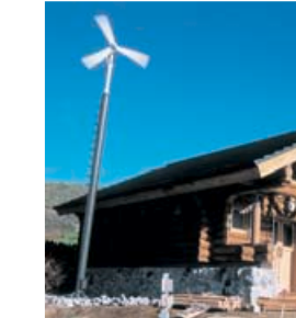
▲大高山黒岳 バイオトイレ