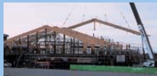
▼別海町 東園小学校 体育館