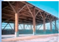
▼別海町中西別 今井牧場 堆肥舎