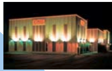
▼別海町 遊技場外壁