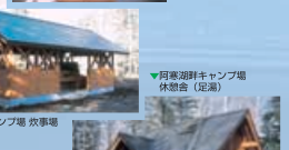
▲阿寒湖畔キャンプ場 休急舎(足湯)