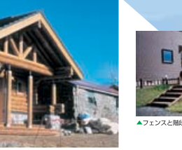
▼浜中町 湯涌テント市場