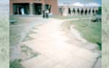
▲別海町 北浜展望台木レンガ